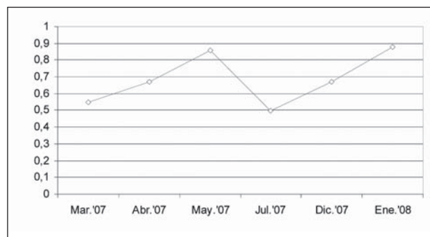
Figura 3. Seguimiento de la PVIA en el paciente 3

Portador de una prótesis tipo Goretex®, realizado el 23/01/2007 y puncionado por primera vez el 21/02/2007. Se obtienen valores de PVIA entre 0,55 y 0,86, practicándosele una angioplastia en junio del 2007, con un valor posterior límite de 0,5. Los valores de PVIA continuaron aumentando hasta alcanzar la cifra de 0,88, tras la cual se le practicó una segunda angioplastia en febrero del 2008, siendo efectiva, ya que se normalizaron los valores de PVIA (figura 3). Ante la posibilidad de que el problema radique en la anastomosis venosa y aunque la PVIA sea normal pensamos que este paciente tiene mayor riesgo de sufrir un fallo del acceso vascular.