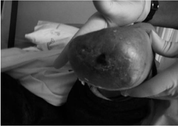
Figura 4: 7ª Semana