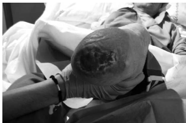
Figura 3: 4ª Semana