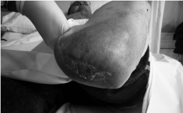
Figura 5: Fin de tratamiento

Tras dos meses de tratamiento de terapia combinada se logró la recuperación total de la integridad cutánea a nivel talón del pie izquierdo sin molestias para el paciente derivadas del tratamiento realizado, por lo que concluimos que el protocolo utilizado es eficaz para el tratamiento de heridas de evolución tórpida en pacientes nefrológicos.