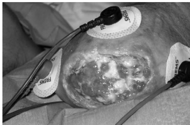
Figura 2: 2ª Semana